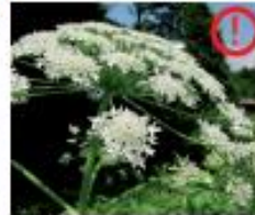
Riesenbärenklau Heracleum mantegazzianum Wurzeln, Blüten und Samen