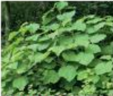
Blauglockenbaum Paulownia tomentosa Wurzeln, Blüten und Samen