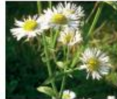
Einjähriges Berufkraut Erigeron annuus Ganze Pflanze