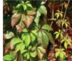
Jungfernebe Parthenocissus agg. P. inserta/P. quinquefolia Ganze Pflanze