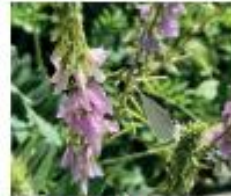
Geissraute Galega officinalis Hülsenfrüchte