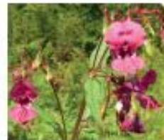
Drüsiges Springkraut Impatiens glandulifera Ganze Pflanze