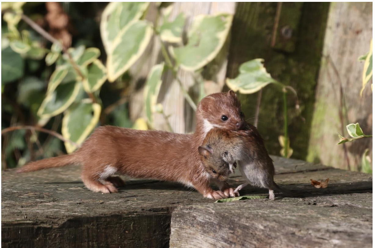
Bildlegende: Wiesel ernähren sich von Mäusen und sind wertvolle Mitarbeiter in der Landwirtschaft.