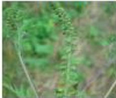
Ambrosia Ambrosia artemisiifolia Ganze Pflanze