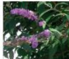
Sommerflieder Buddleja davidii Blüten und Samen