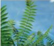
Götterbaum Ailanthus altissima Wurzeln, Blüten und Samen