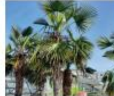
Hanfpalme Trachycarpus fortunei Blüten und Früchte