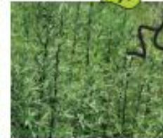
Verlotscher Beifuss Artemisia verlotiorum Ganze Pflanze