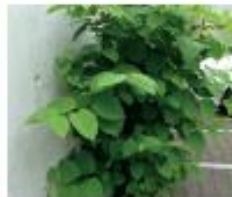
Staudenknöteriche Reynoutria spp. Alles Pflanzenmaterial aus dem Boden