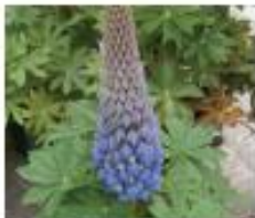
Vielblättrige Lupine Lupinus polyphyllus Ganze Pflanze