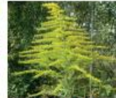
Amerik. Goldruten Solidago canadensis, S. gigantea Ganze Pflanze