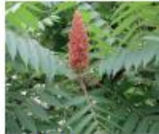
Essigbaum Rhus typhina Wurzeln, Blüten und Samen