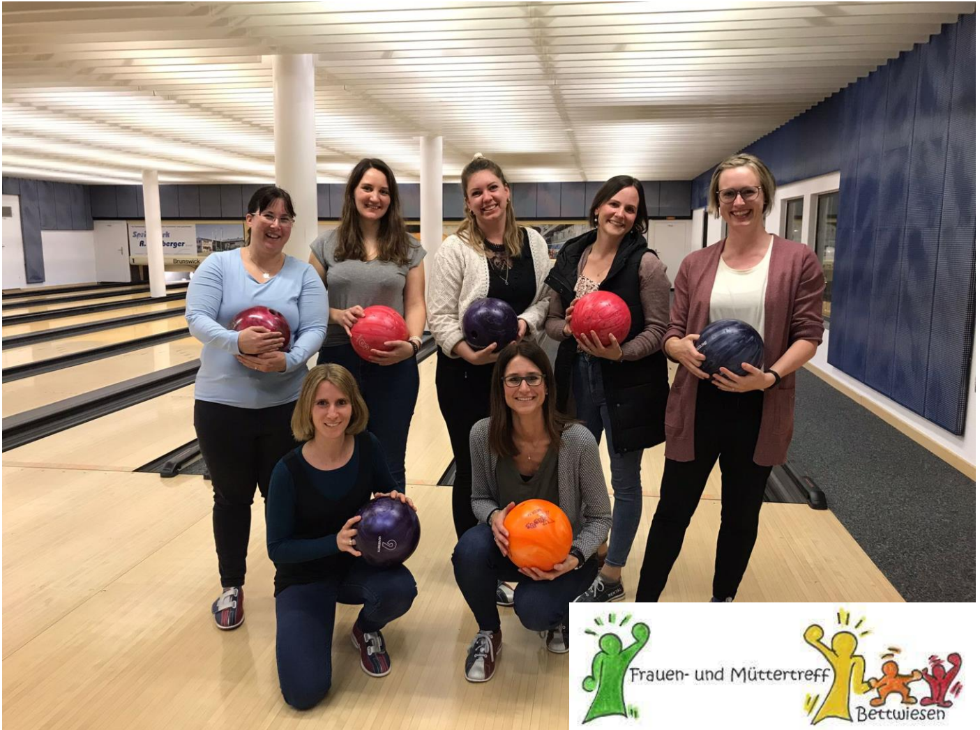
Mütter und Frauentreff Bettwiesen

Erneut erlebten wir gemeinsam einen gemütlichen Bowlingabend. Leckere Drinks und tolle Gespräche liessen die Stunden verstreichen. Nächstes Jahr werden wir wieder einen Bowlingabend planen.