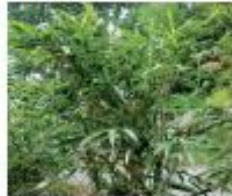
Japanischer Bambus Pseudosasa japonica Wurzeln, Blüten und Samen