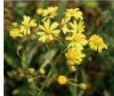
Schmalbl. Greiskraut Senecio inaequidens Ganze Pflanze