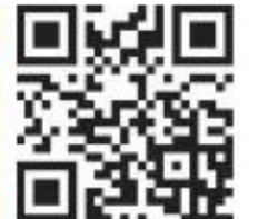
Weitere Pflanzen und Informationen

Wo Sie den Neophytensack kostenlos beziehen und wo Sie ihn entsorgen können, entnehmen Sie bitte dem Abfallkalender Ihrer Gemeinde. Grössere Mengen an Ast- und Wurzelmaterial können direkt bei der KVA Thurgau oder beim ZAB angeliefert werden.