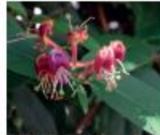
Asiatische Geissblätter Lonicera henryi, L. japonica Ganze Pflanze