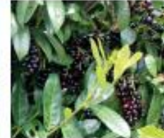
Kirschchlorbeer Prunus laurocerasus Früchte und Wurzeln