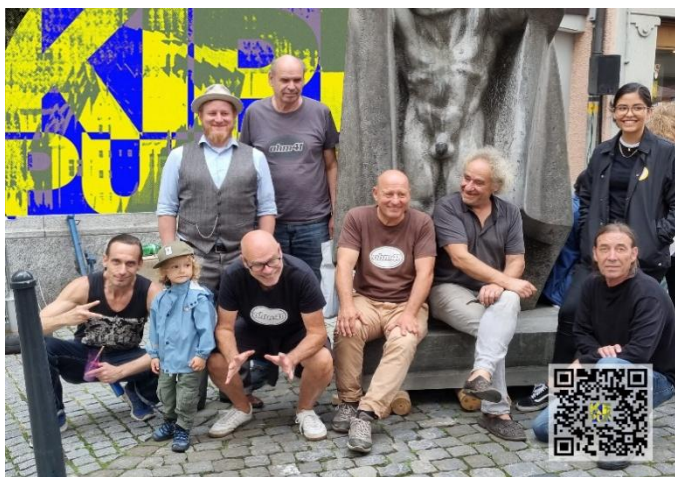
Das Kernteam von ohm41 mit Nachwuchs.

Das Kunstkollektiv ohm41 zeigt vom 7. Juni bis 5. Juli 2026 das Projekt «KIPPPUNKT» auf dem Areal der Komturei Tobel in Tobel-Tägerschen. 27 Kunstschafter bespielen das historische Gelände mit Objekten, Installationen und Performances. Die Vernissage findet am Sonntag, 7. Juni um 15 Uhr statt, mit «Pilzsteckerzeremonie» und Apéro. Die Ausstellung ist dienstags bis freitags von 18 bis 21 Uhr sowie samstags und sonntags von 10 bis 13 Uhr geöffnet. Höhepunkte sind die Walk + Talk-Performances, das Konzert am 19.6. und ein Kunst-Karaoke-Abend mit Nachtessen am 2.7. Führungen für Schulen und Gruppen können gebucht werden. Mehr Infos auf www.ohm41.ch